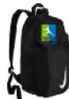
Sac à Dos