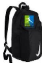
Sac à Dos